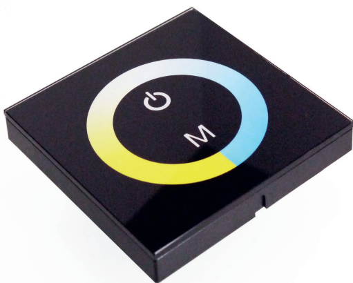
Zeichnung / drawing