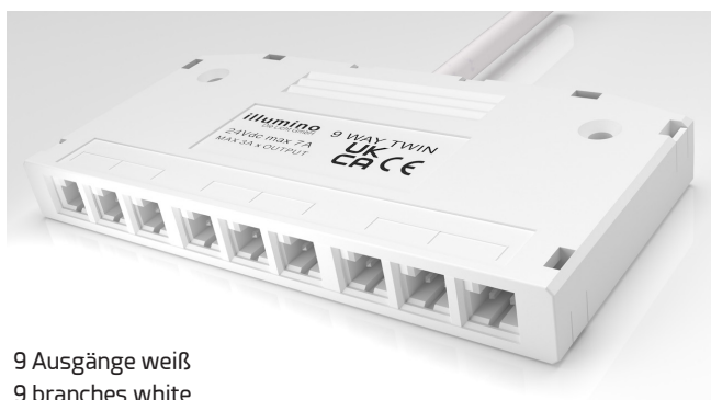
9 Ausgänge weiß 9 branches white