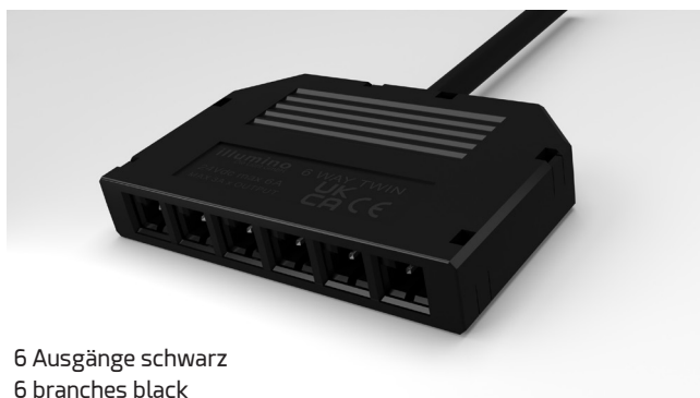
6 Ausgänge schwarz 6 branches black