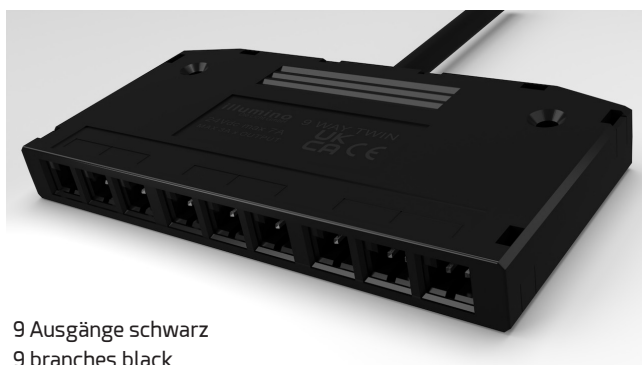
9 Ausgänge schwarz 9 branches black