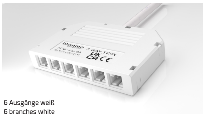
6 Ausgänge weiß 6 branches white